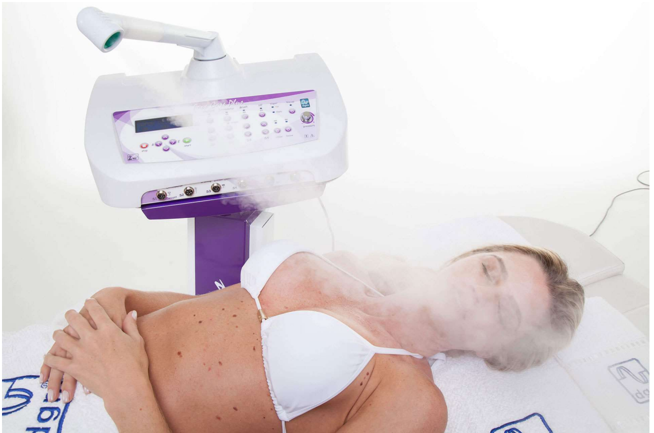
VAPORIZADOR FACE CARE PLUS / ESCOVAS GIRATÓRIAS