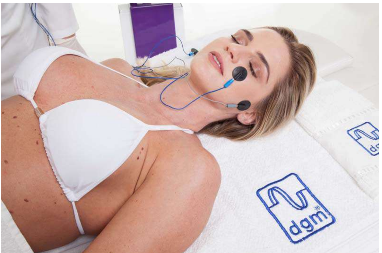
• CORRENTE RUSSA, AUSTRALIANA FACIAL

Este curto intervalo de passagem de corrente proporciona um conforto ainda maior, porém, é necessário aplicar uma dose com maior intensidade. Tem as mesmas indicações da Corrente Russa.