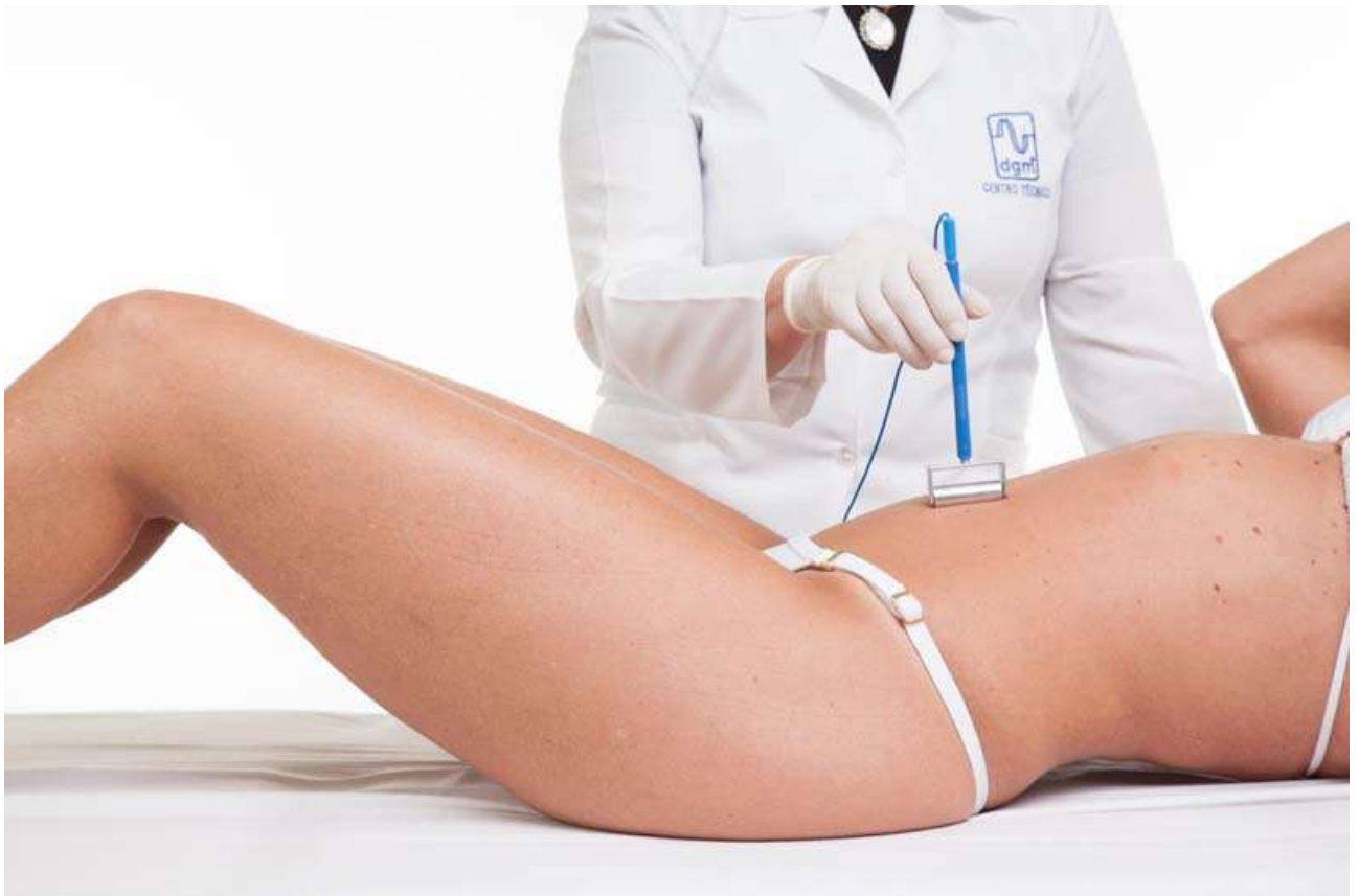
ROLETE IONIZAÇÃO CORPORAL