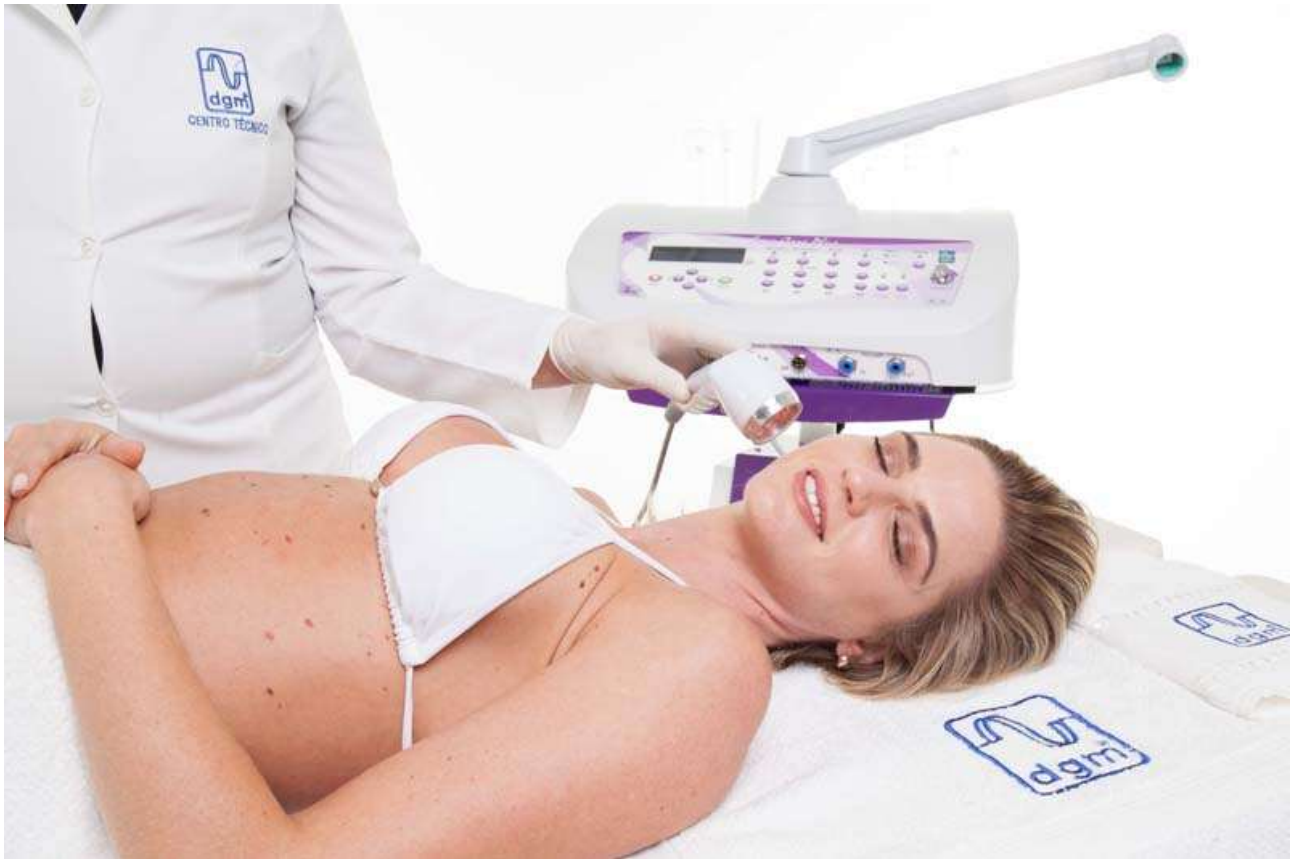
CANETAS DE LEDS