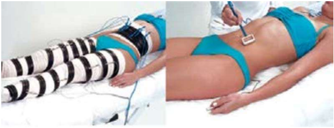
IONIZAÇÃO DE GRANDE SUPERFÍCIE