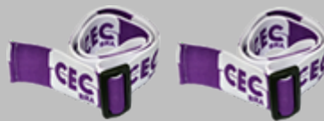
Faixa Elástica Ajustável